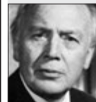
Václav Trojan REŽISÉR