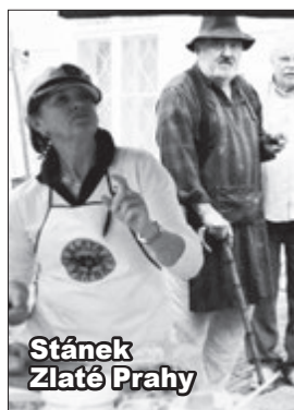
Stánek Zlaté Prahy