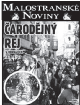
Čís. 6, červen 2015