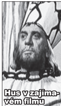
Hus v zajímavém filmu

Toulka v sedě - tentokrát k aktuálnímu tématu šestistého výročí upálení mistra Jana Husa v kostel sv. Jana Křtitele (Na Prádle). Nový úhel pohledu, nové poznání starých pravd.