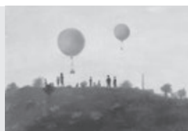
K. Lhoták - Dva balóny nad Bohdalem, olej na plátně.

Výstava raných olejomalb a klíčových Lhotákových děl z let 1938 až 1951 ze soukromých sbírek. Připraveno ve spolupráci Musea Kampa a Retro Gallery.