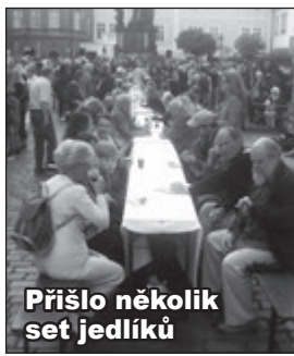
Přišlo několik set jedlíků