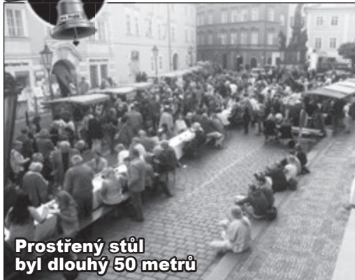
Prostřený stůl byl dlouhý 50 metrů

KampaNula Na krásné akci se získalo 40 tisíc Kč pro charitu