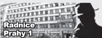
Radnice Prahy 1