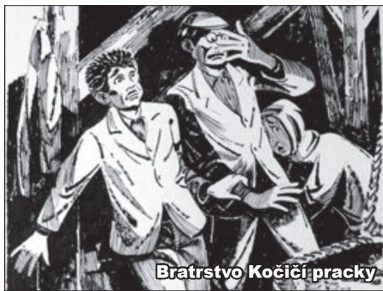
Bratrstvo Kočičí pracky

Otázka: Dokážete nalézt toto zákoutí, kde spisovatel tvořil? Popište místo, které zachycují oba snímky!