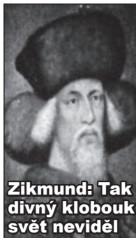
Zikmund: Tak divný klobouk svět neviděl

Vliv Jana Husa na světové dějiny byl zásadní. Skvělý kazatel, rektor Karlovy univerzity, kázal česky v Betlémské kapli (v první čistě kazatelské kapli v Evropě) a ovlivnil tak desítky tisíc lidí. Kázal deset let, vždy bylo plno. Hus je uznáván jako jeden ze tří hlavních představitelů reformního hnutí (Wiklef, Luther). Role krále Zikmunda v obecném povědomí je příliš negativní. Zikmund dal Husovi listinnou ochranu na cestu. Zasadil se, aby mu při jeho vězně-