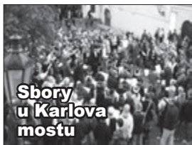
Sbory u Karlova mostu