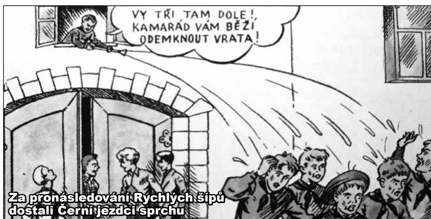
Za pronásledování Rychlých šípů dostali Černí jezdci sprchu