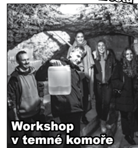
Workshop v temné komoře

Máte oblíbený obchůdek ve svém okolí? Pište: redakce@malostranskenoviny.eu