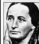
Božena Němcová SPISOVATELKA