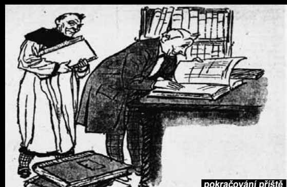
Za pětičku dovolí kostelník od sv. Barabáše nahlédnout do matrik ke zjištění minulosti různých protikandidátů.