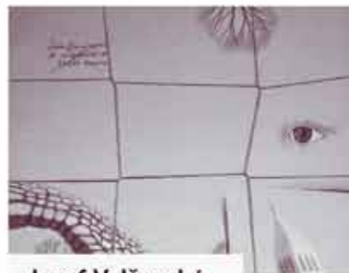
Josef Velčovský Balíček z Rovinje

Zdarma ohodnotíme vaše předměty, zastavte se u nás v galerii na Maltézském náměstí 3 nebo pošlete fotografie na e-mail: info@aukceaukci.cz , poradce na telefonu 601 344 355.