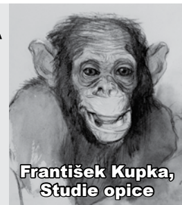
František Kupka, Studie opice