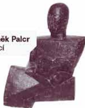
Zdeněk Palcr Sedící