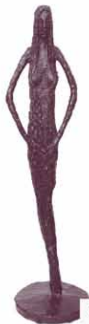
Olbram Zoubek Jezerní panna

VYBÍRÁME Z BŘEZNOVÉ AUKCE. UKONČENÍ AUKCE BUDE 1. - 3. 3. 2022.