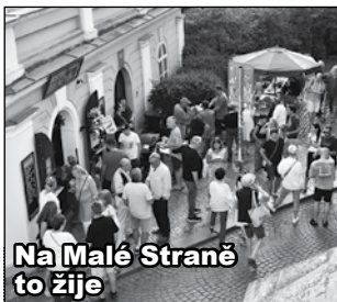
Na Malé Straně to žije

Na Malé Straně, na Hradčanech samozřejmě také, žijeme ve zvláštní dvojakosti. Běžně se stává, že uživatelé bytů se v domě, ve kterém bydlíte, mění tempem dříve nevidaným. Někdy náhodně zjistíte, že máte přes chodbu nové sousedy. Máte štěstí, pokud se s nimi domluvíte, což nemá nic společného se znalostí cizích jazyků, spíše se jedná o výpadek jejich paměti, oni se určitě také kdysi učili, že lidé, kteří se potkají na chodbě společného domu, pozdraví. To vše bývá vyváženo zjištěním, že sousedé, co bydlí už nějakou dobu o dvě patra pod vámi, najednou beze slova zmizí, jakoby se do-