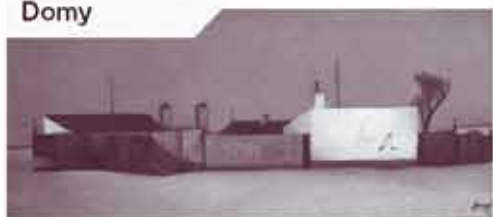
Vlastimil Beneš Domy

Pokud máte nějaký zajímavý obraz, kresbu, grafiku, sochu, mince či jiný umělecký artefakt, budeme rádi, když nám ho nabídnete.