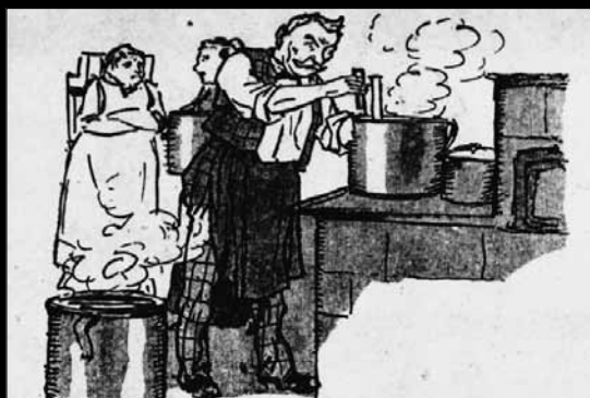
Starý, osvědčený prostředek - pivo, nutno si navařit do zásoby doma.

Malostranské noviny k počtě Humoristickým listům (1922)