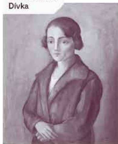
Otakar Kubín Dívka