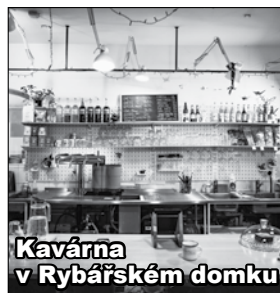
Kavárna v Rybářském domku